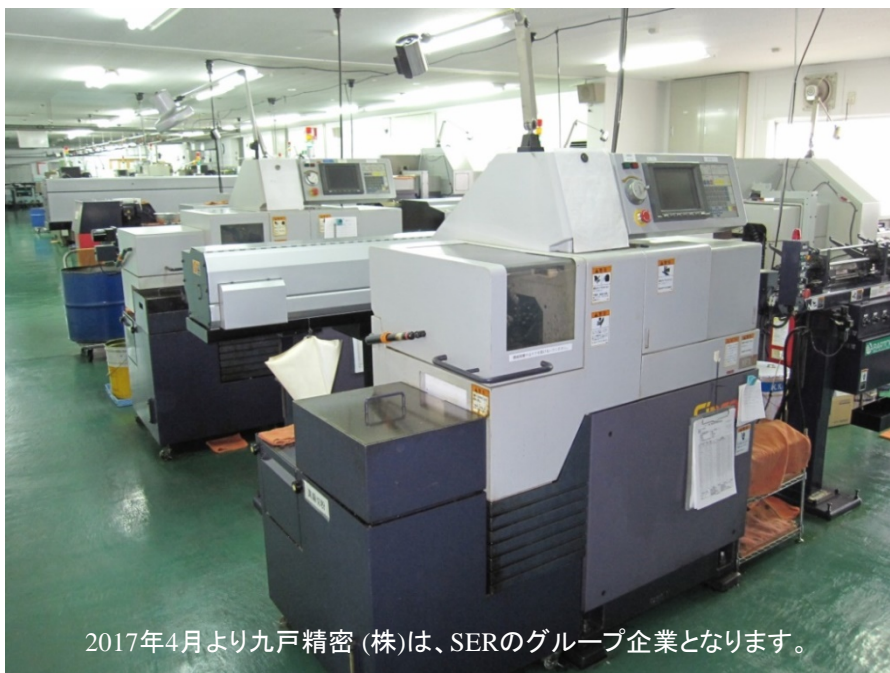
2017年4月より九戸精密(株)は、SERのグループ企業となります。